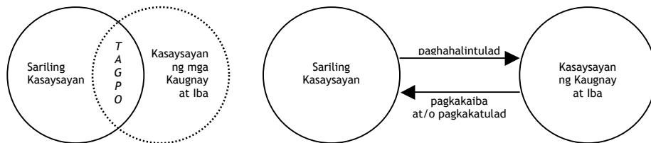
Larawan 2 Saklaw ng Kasaysayang Kabanwahan

kasaysayan ng migrasyon sa Pilipinas; kasaysayang komparatibo; at pangkasaysayang araling pang-erya (Navarro 1999b, 2000b, 2000c, 2005, 2006, 2007a, 2007b). Pinapaksa ng kasaysayan ng diplomasya at kasaysayan ng migrasyon ang mga yugto sa kasaysayan kung kailan at saan may pagtatagpo ang sariling kabihasan sa kaugnay na kabihasan at/o ibang kabihasan na tampok sa ugnayang panlabas ng Pilipinas. Sa mga pagkakataong walang tiyak o tuwirang pagtatagpo, maaaring sa paraan ng paghahalintulad ang pagpaksa sa kaugnay na kabihasan at/o ibang kabihasan sa diwa ng kasaysayang komparatibo. Ngunit kahit walang tiyak at tuwirang pagtatagpo at paghahalintulad, maaari pa ring paksain ang mismong kabuuan ng kaugnay na kabihasan at/o ibang kabihasan na makakapagpalawak ng sariling pananaw pandaigdig sa diwa naman ng pangkasaysayang araling pang-erya. Maaaring ilarawan ang mga ito sa isang diagram na ginagamit bilang kasangkapang heuristiko upang ipakita ang saklaw ng Kasaysayang Kabanwahan :